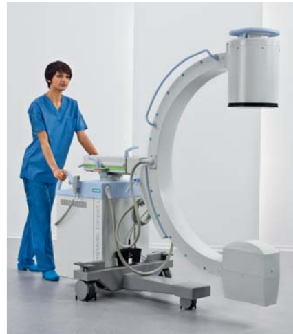
Die durchgehend ergonomische Bauweise sorgt für hohe Beweglichkeit des C-Bogens

Bei SIREMOBIL Compact L bekommt die Kundenbetreuung eine ganz neue Dimension: Siemens bietet eine Vielzahl an Programmen und Dienstleistungen für die beständige Weiterentwicklung von Kompetenz, Produktivität und Technologie bereits ab dem Zeitpunkt des Kaufs. Wir helfen Ihnen bei der Steigerung Ihrer Leistungsfähigkeit, Ihrer Produktivität und der Zufriedenheit Ihrer Patienten. Denn nur das zählt im Gesundheitswesen von heute. Darüber hinaus bietet Siemens zahlreiche Service-Optionen für medizinische Hardware und Software. Sie profitieren dabei von verbesserter Systemverfügbarkeit, optimierter Leistung und hoher Effizienz des Workflows.